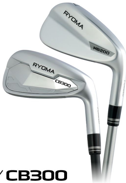
RYOMA IRON MB200 / CB300